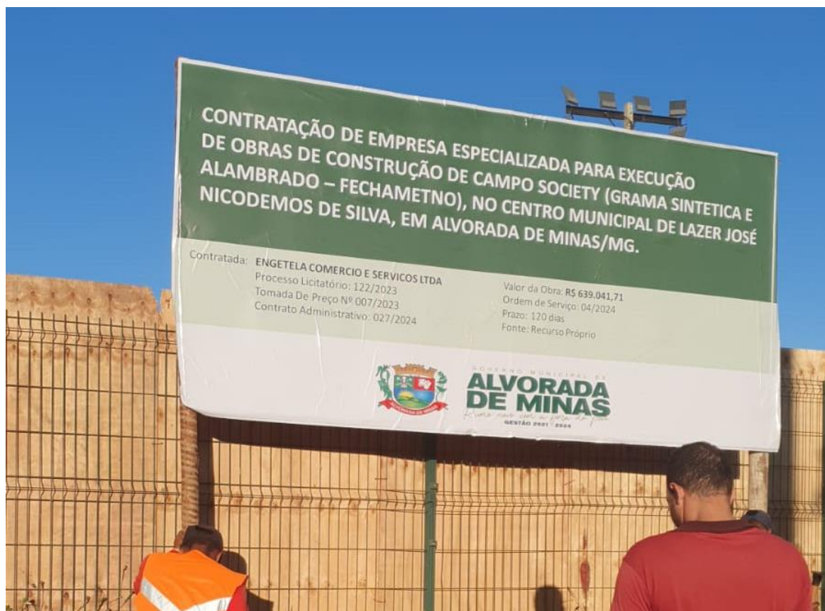
PLACA DA OBRA