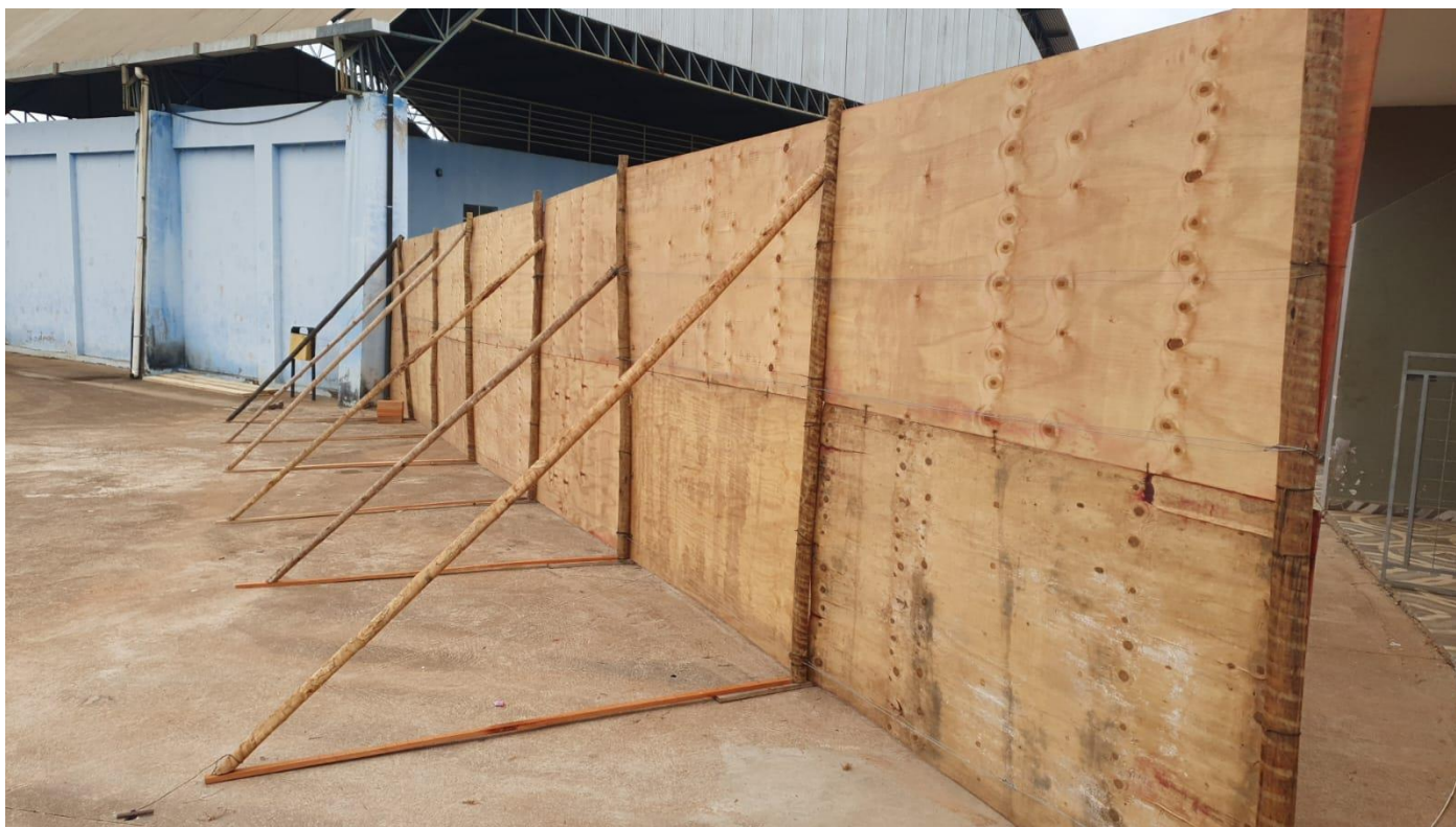
FECHAMENTO DO PERIMETRO DE OBRA COM TAPUME DE MADEIRA