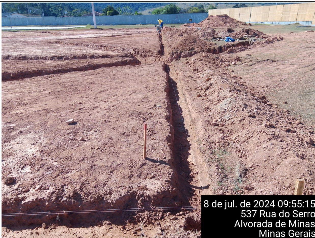
ESCAVAÇÃO DA VALA DA VIGA BALDRAME DO CAMPO

Informações sobre a fotografia apresentada: