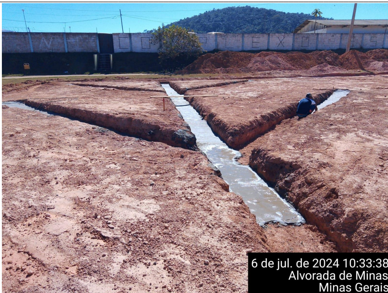
EXECUÇÃO DA CONCRETAGEM DA BASE DA DRENAGEM

Informações sobre a fotografia apresentada: