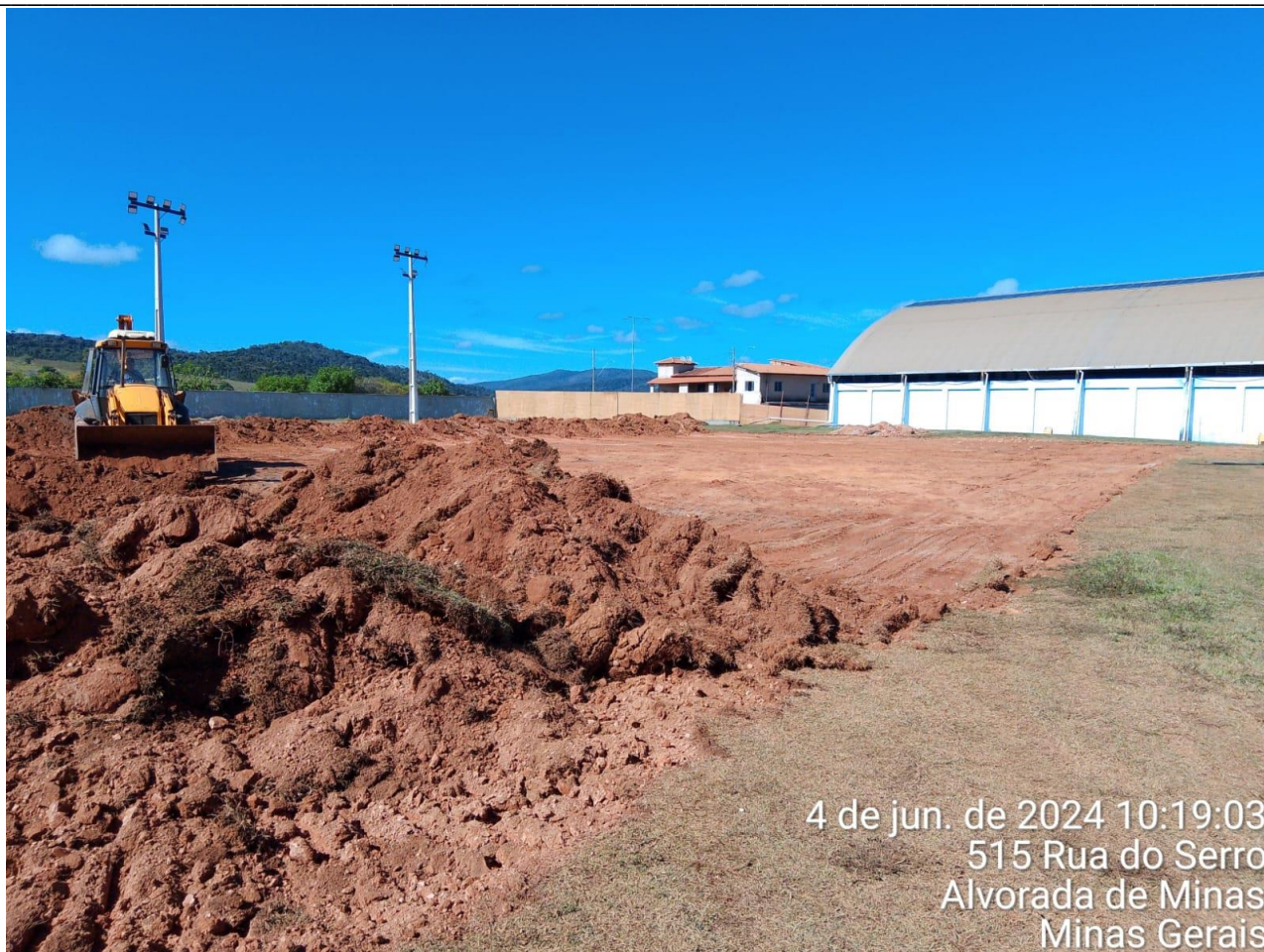
REMOÇÃO E MOVIMENTAÇÃO DO MATERIAL ORGÂNICO