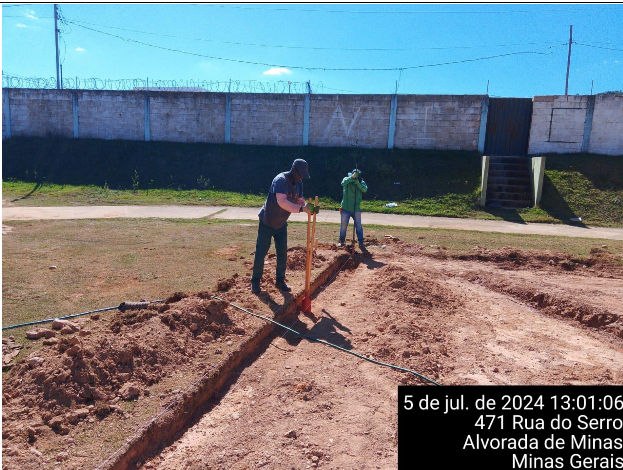
ABERTURA MANUAL DAS FUNDAÇÕES DO ALAMBRADO