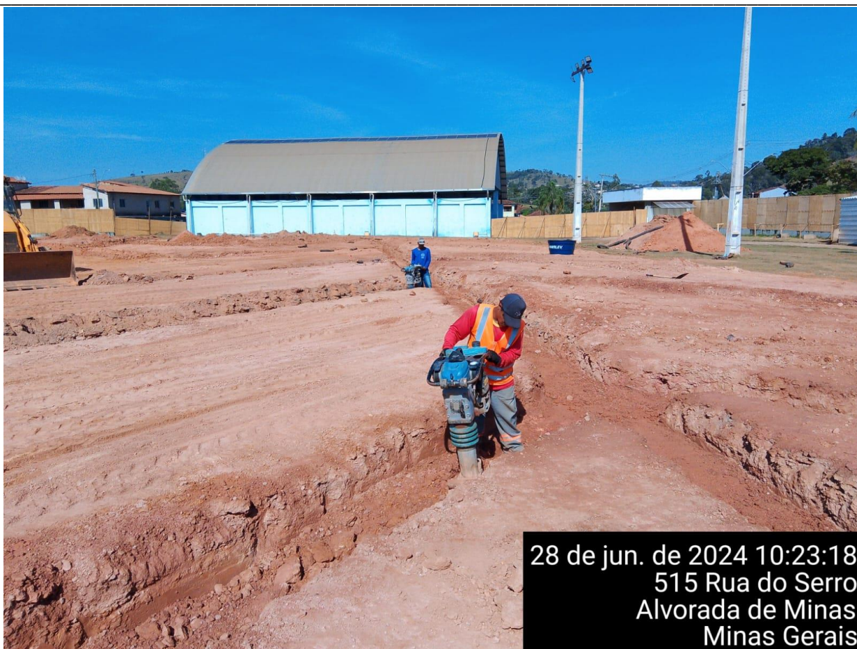
COMPACTAÇÃO ÚMIDA DA VALA DE DRENAGEM