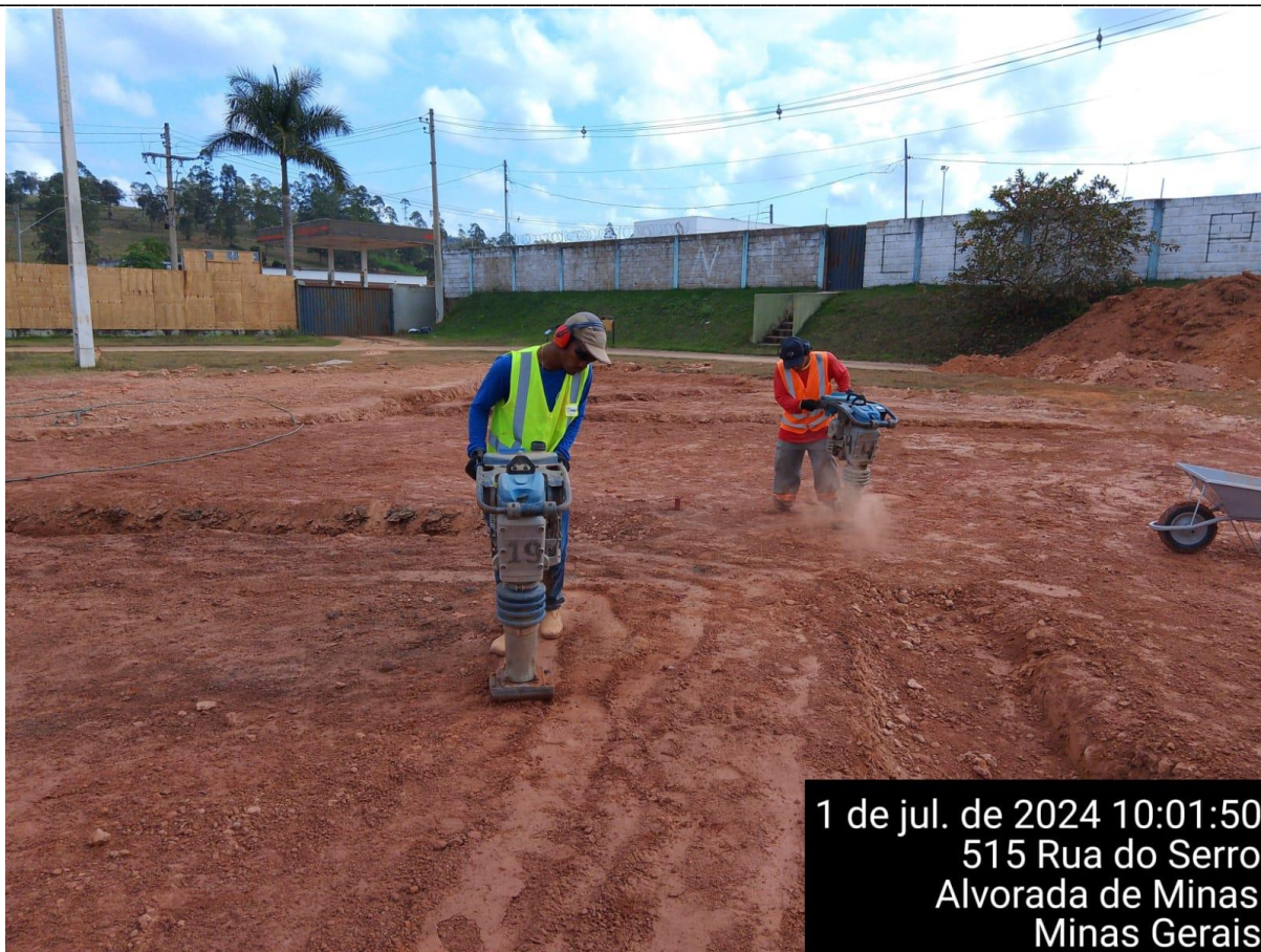
EXECUÇÃO DA COMPACTAÇÃO ÚMIDA DA BASE DO CAMPO

Etapa: [2] 1 – antes da realização da obra 2 – Durante a realização da obra 3 – Após a realização da obra