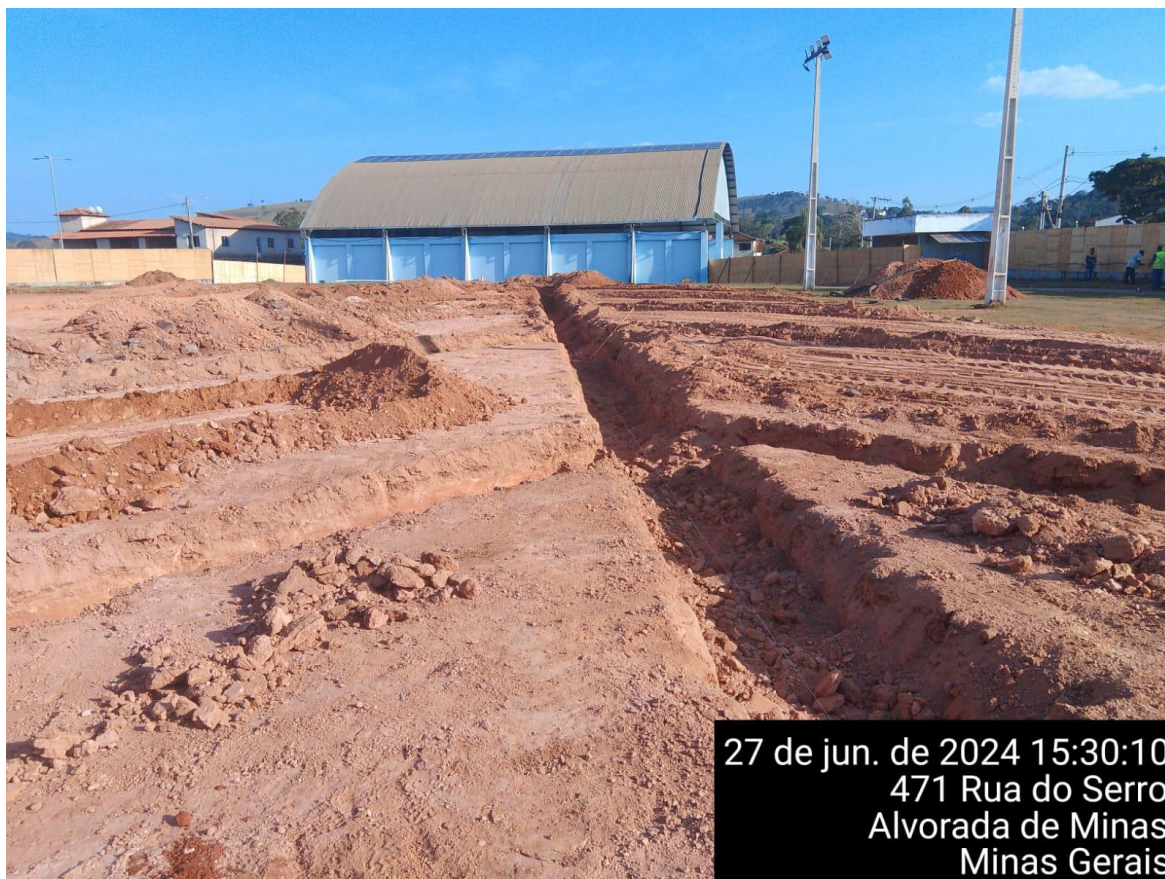
ESCAVAÇÕES DE DRENAGEM COM INCLINAÇÃO DE 1%

Etapa: [2] 1 – antes da realização da obra 2 – Durante a realização da obra 3 – Após a realização da obra