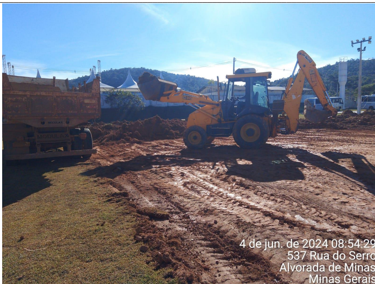
ESCAVAÇÃO DO MATERIAL ORGÂNICO

Informações sobre a fotografia apresentada: