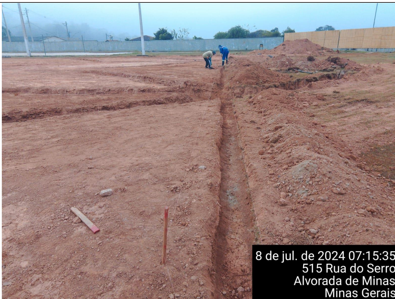
ESCAVAÇÃO DA VALA DA VIGA BALDRAME DO CAMPO

Objeto: OBRA: CONTRATAÇÃO DE EMPRESA ESPECIALIZADA PARA EXECUÇÃO DE OBRAS DE CONSTRUÇÃO DE CAMPO SOCIETY (GRAMA SINTETICA E ALAMBRADO – FECHAMENTO), NO CENTRO MUNICIPAL DE LAZER JOSÉ NICODEMOS DE SILVA, EM ALVORADA DE MINAS/MG