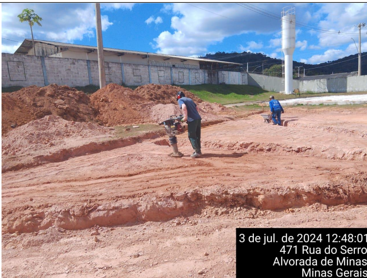
COMPACTAÇÃO COM REBAIXO DIFERENCIAL DE +/- 4CM

Objeto: OBRA: CONTRATAÇÃO DE EMPRESA ESPECIALIZADA PARA EXECUÇÃO DE OBRAS DE CONSTRUÇÃO DE CAMPO SOCIETY (GRAMA SINTETICA E ALAMBRADO – FECHAMENTO), NO CENTRO MUNICIPAL DE LAZER JOSÉ NICODEMOS DE SILVA, EM ALVORADA DE MINAS/MG