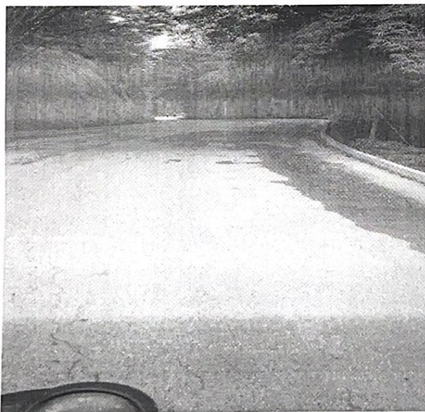
IMAGEM 03: meio fio e sarjeta Bandeirinha