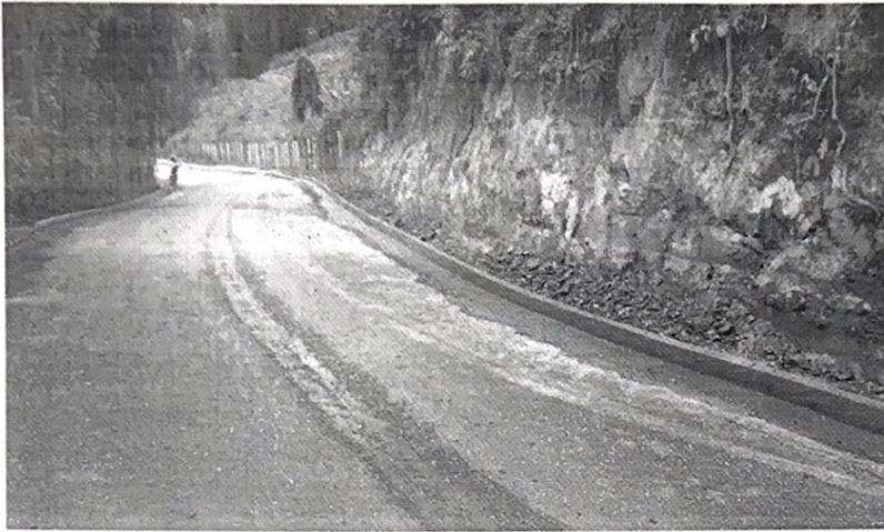
IMAGEM 04: meio fio e sarjeta Bandeirinha