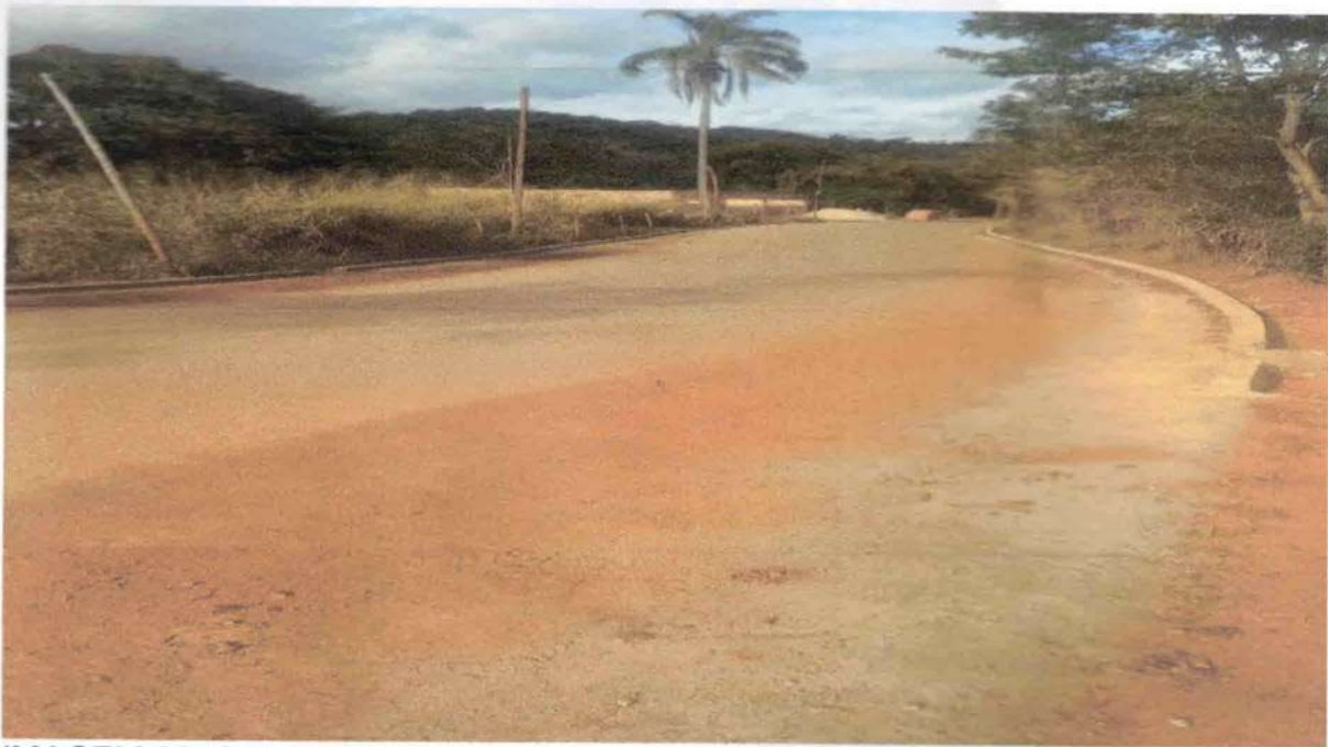
IMAGEM 06: área que será recapeada em micro revestimento.

DESPP – Departamento de Engenharia, Serviços, Programas e Projetos