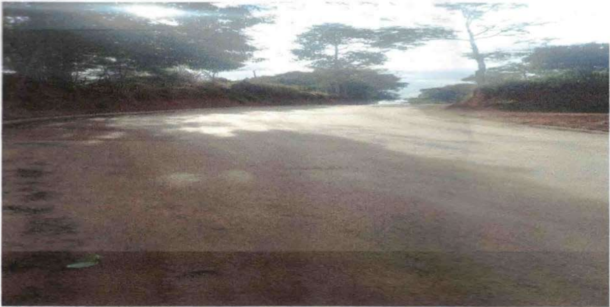
IMAGEM 02: A superfície da via apresenta-se lisa e polida por desgaste dos inertes devido ao efeito abrasivo decorrente da ação do tráfego.

DESPP – Departamento de Engenharia, Serviços, Programas e Projetos