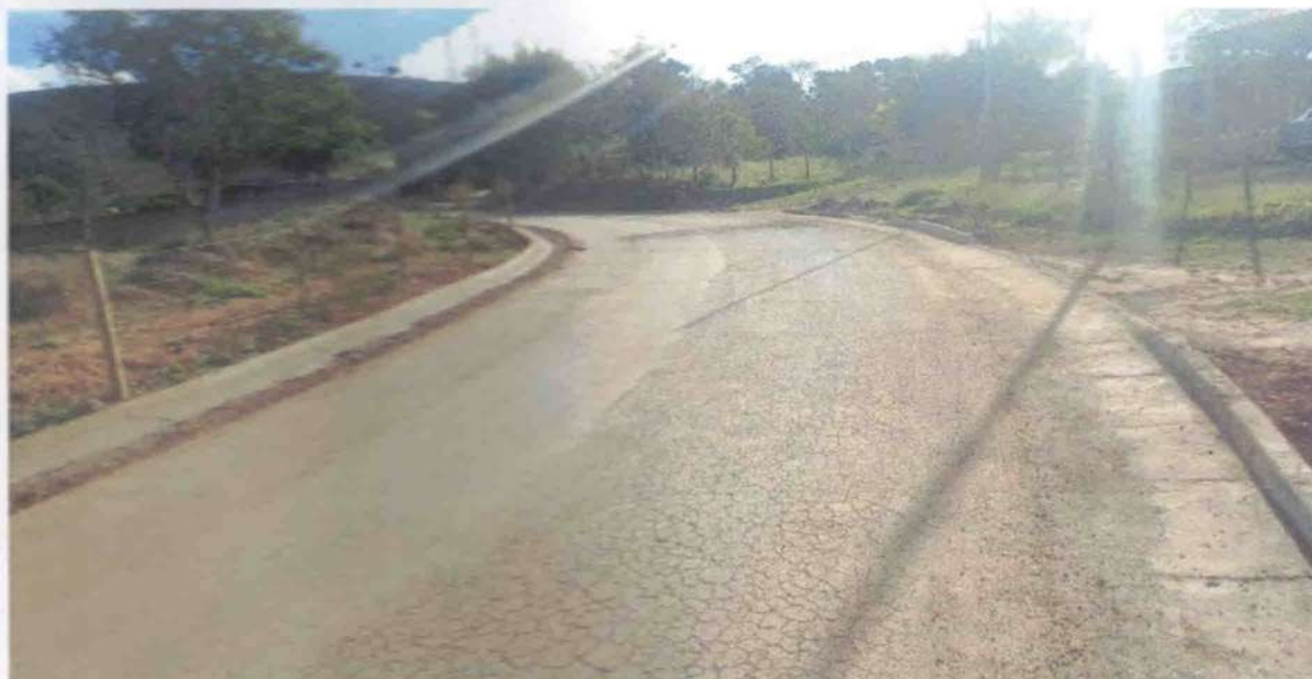
IMAGEM 01: Fissuras no pavimento, tipo couro de jacaré

Fonte de recurso: Recursos não vinculados de impostos.