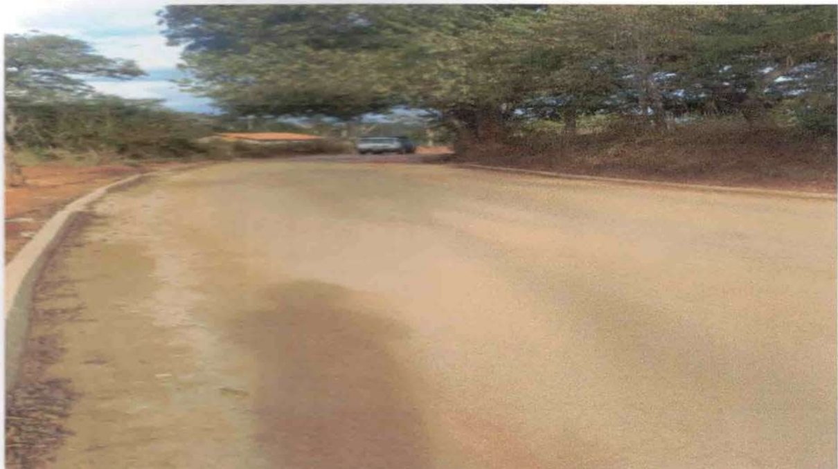
IMAGEM 05: Pavimento a ser recapeado