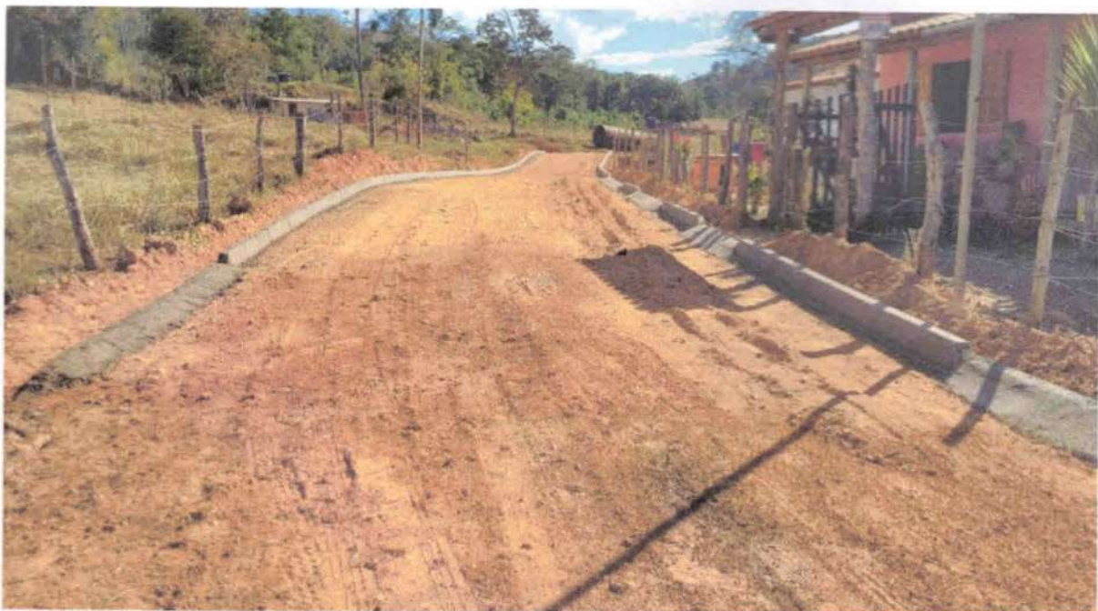
IMAGEM 07: Loteamento, terraplanagem, execução de meio fio e pavimentação em TSD