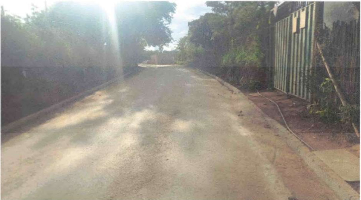
IMAGEM 03: Pavimento a ser recapeado