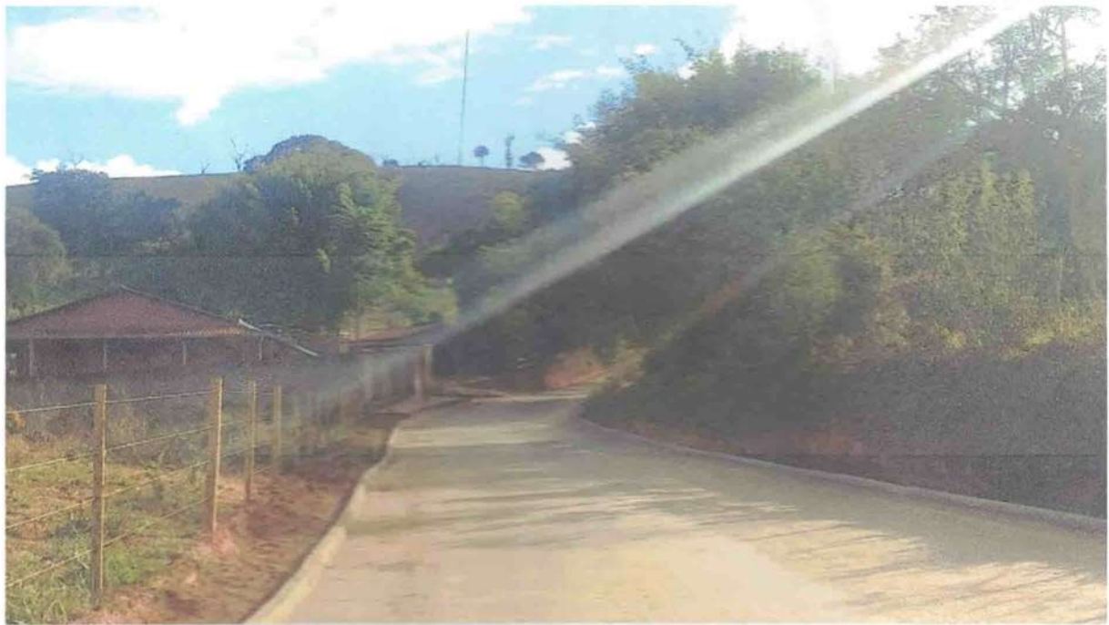
IMAGEM 04: Pavimento a ser recapeado

DESPP – Departamento de Engenharia, Serviços, Programas e Projetos