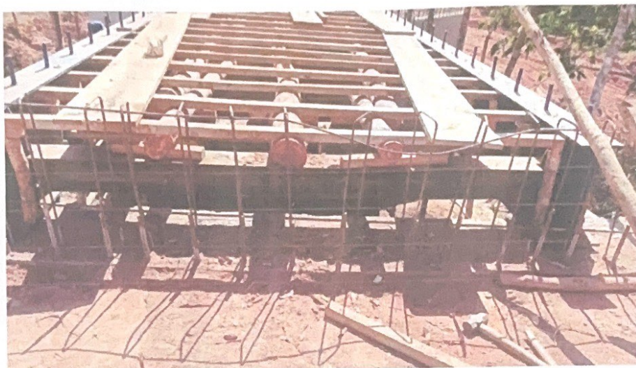
FIGURA 5 FERRAGENS DO TABULEIRO DA PONTE

Estado de Minas Gerais CNPJ: 18.303.164/0001-53 DESPP – Departamento de Engenharia, Serviços, Programas e Projetos