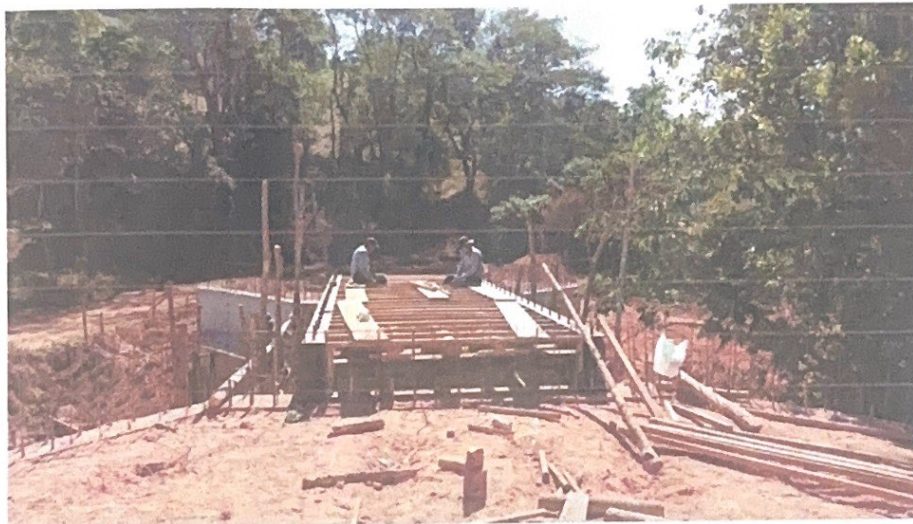
FIGURA 4 ENFORMANDO TABULEIRO DA PONTE