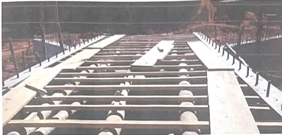
FIGURA 3 PREPARAÇÃO FORMAS

Estado de Minas Gerais CNPJ: 18.303.164/0001-53 DESPP – Departamento de Engenharia, Serviços, Programas e Projetos