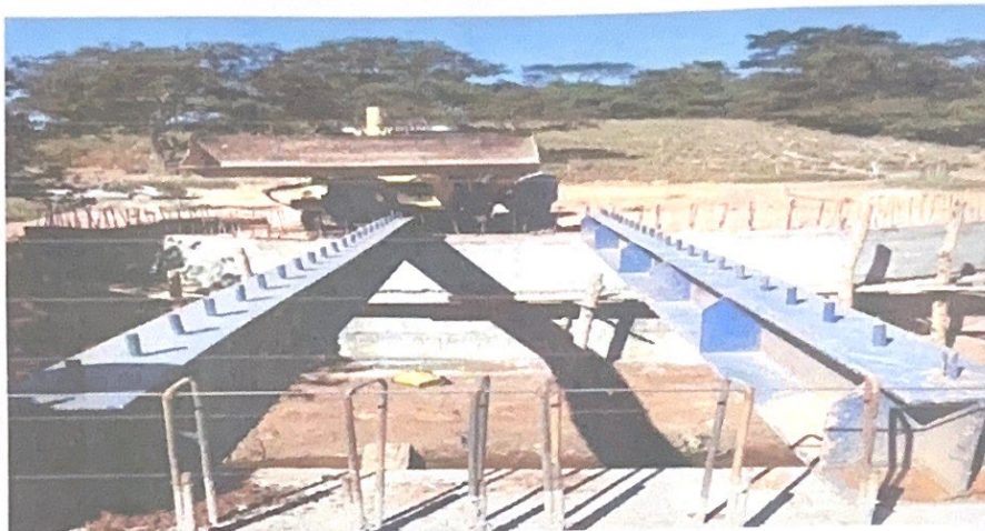
FIGURA 1 MESO ESTRUTURA CONCRETADA

CONSTRUÇÃO DA PONTE DO CORRÉGO DO RIO VERMELHO ZONA RURAL PREFEITURA MUNICIPAL DE ALVORADA DE MINAS/MG CONTRATO ADMINISTRATIVO Nº 013/2023.