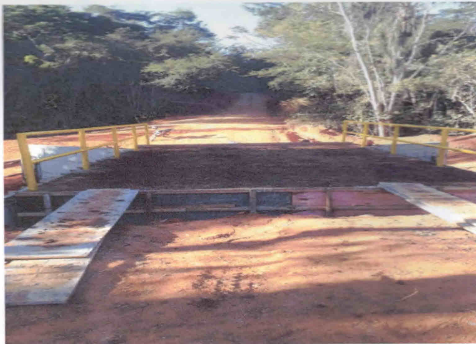
6ª Figura- Finalização da concretagem do tabuleiro e pintura do guarda corpo

DESPP – Departamento de Engenharia, Serviços, Programas e Projetos