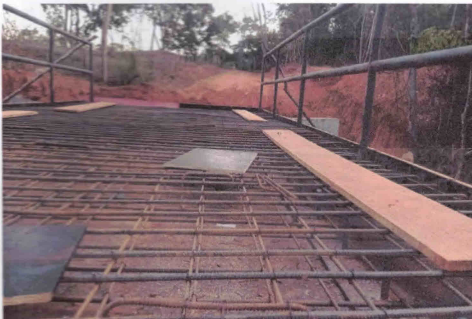
2ª Figura – Armadura do tabuleiro

DESPP – Departamento de Engenharia, Serviços, Programas e Projetos