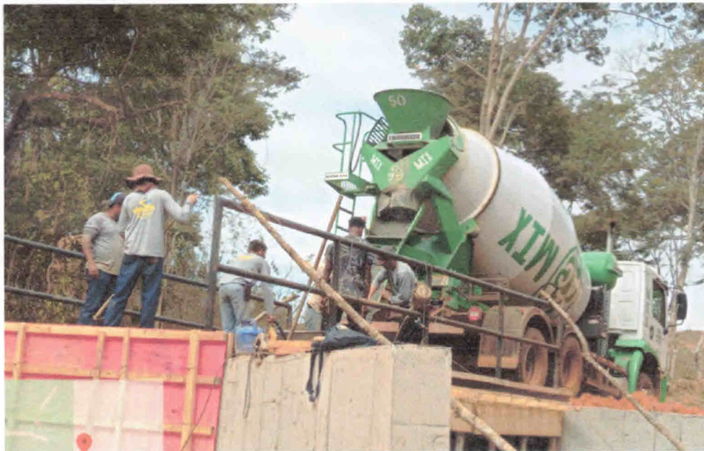
5ª Figura – Concretagem do tabuleiro