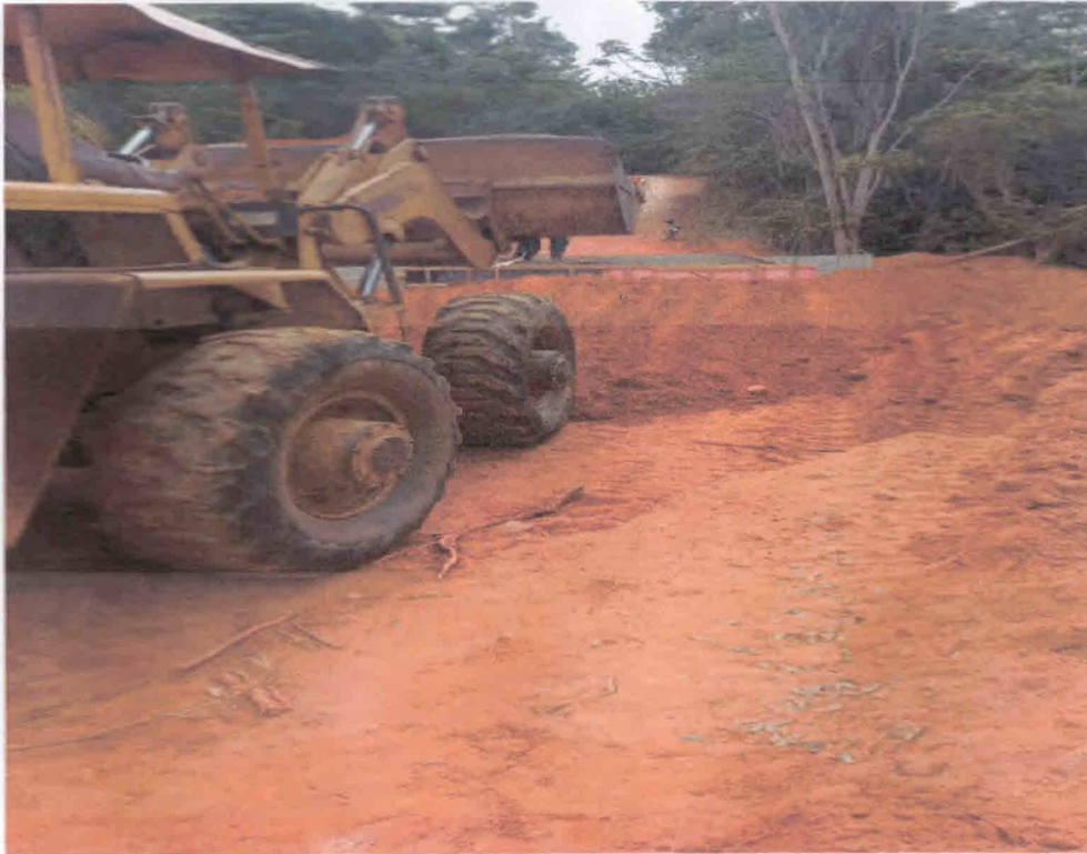
4ª Figura – Reaterro acesso para concretagem do tabuleiro

DESPP – Departamento de Engenharia, Serviços, Programas e Projetos