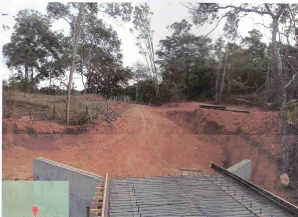
1º Figura- Preparação formas do tabuleiro

CONSTRUÇÃO DA PONTE DO RIBEIRÃO CORRÉGO LIMOEIRO COMUNIDADE RURAL DO RIBEIRÃO DE TRÁS PREFEITURA MUNICIPAL DE ALVORADA DE MINAS/MG CONTRATO ADMINISTRATIVO Nº 013/2023.