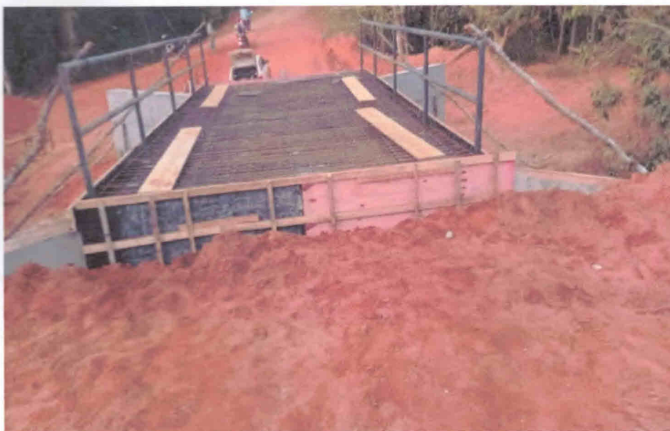
3ª Figura – Término das formas e armadura do tabuleiro inclusive guarda corpo